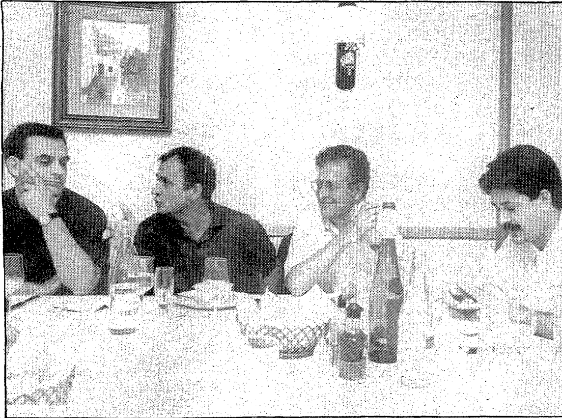
Un moment de la presentació dels llibres. (FRANCESC SUBIRAS).