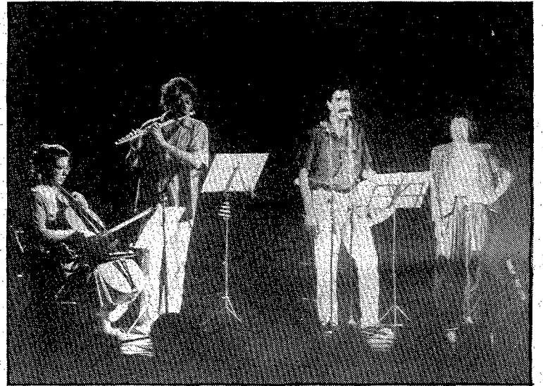
El grup va actuar als jardins de la Devesa. (Foto JOAN CASTRO).